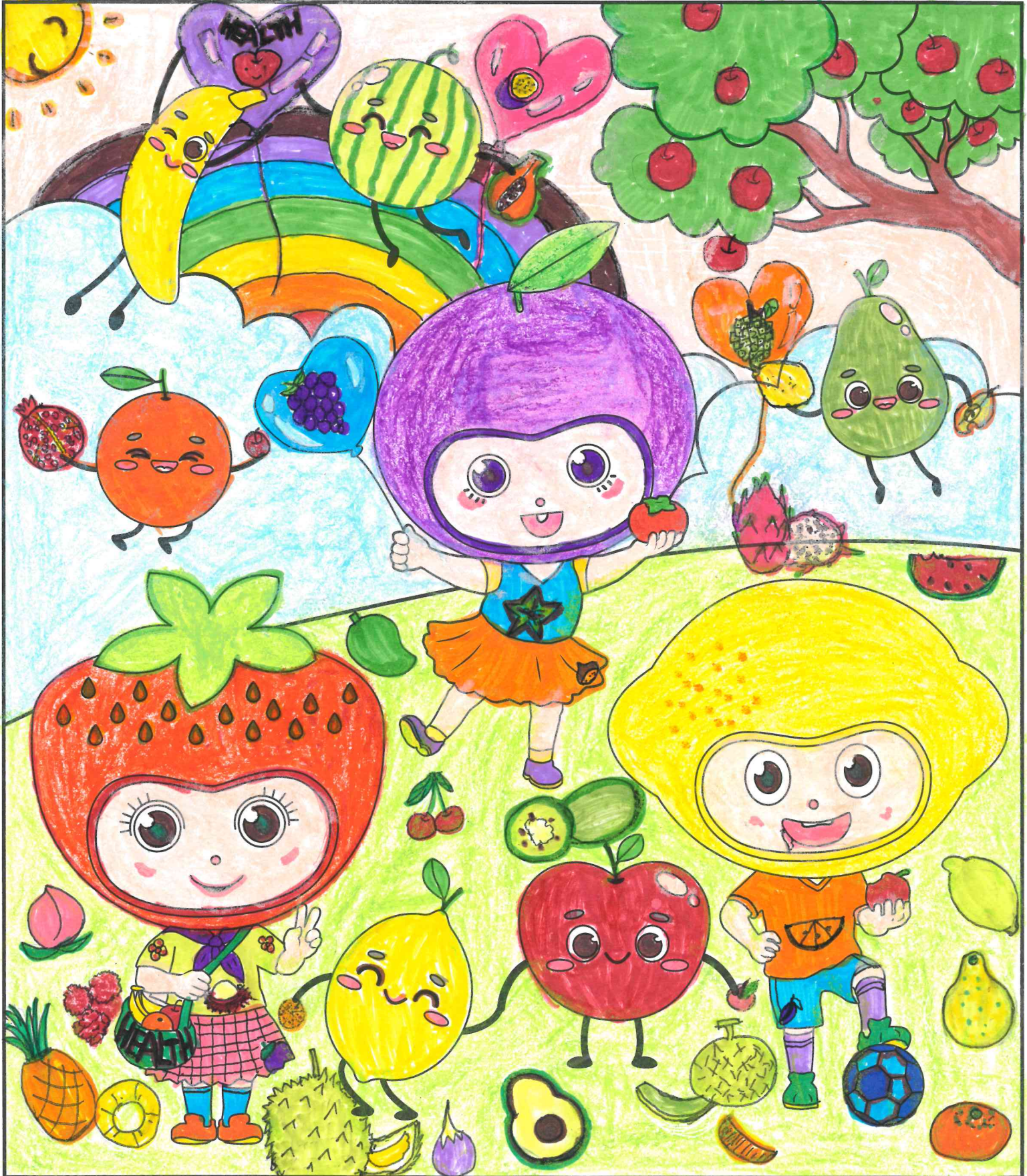
塗上你喜歡的顏色，為水果家族添上繽紛色彩吧！ Add your favourite colours and bring vividness to the Fruit Family!